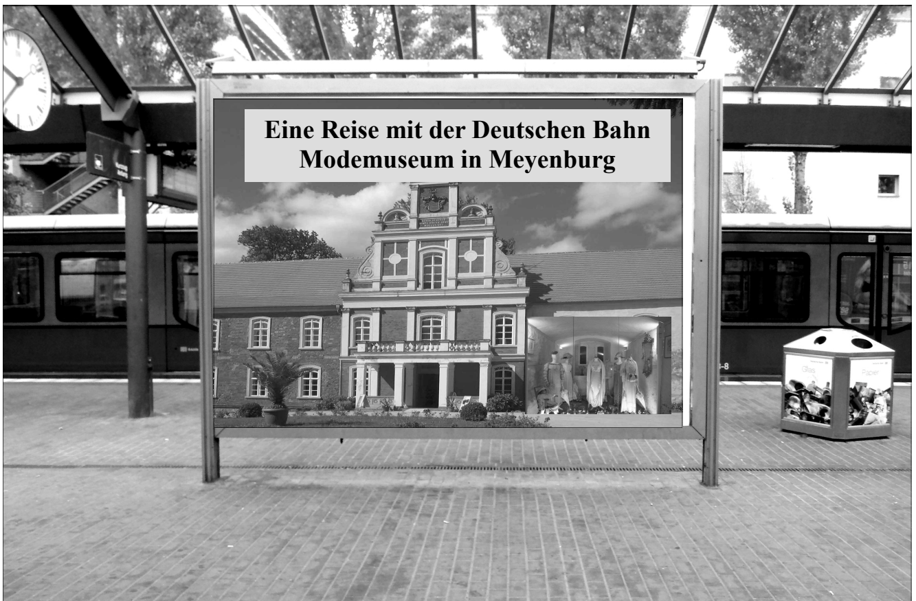
Es ist nicht das Original, es ist unser Gegenvorschlag. Es ist eine Art der Reisekultur, die Spaß und Lust auf Kultur im Land Brandenburg macht. 100 Jahre Modegeschichte werden gezeigt. Einmalig in der Gestaltung und Präsentation.