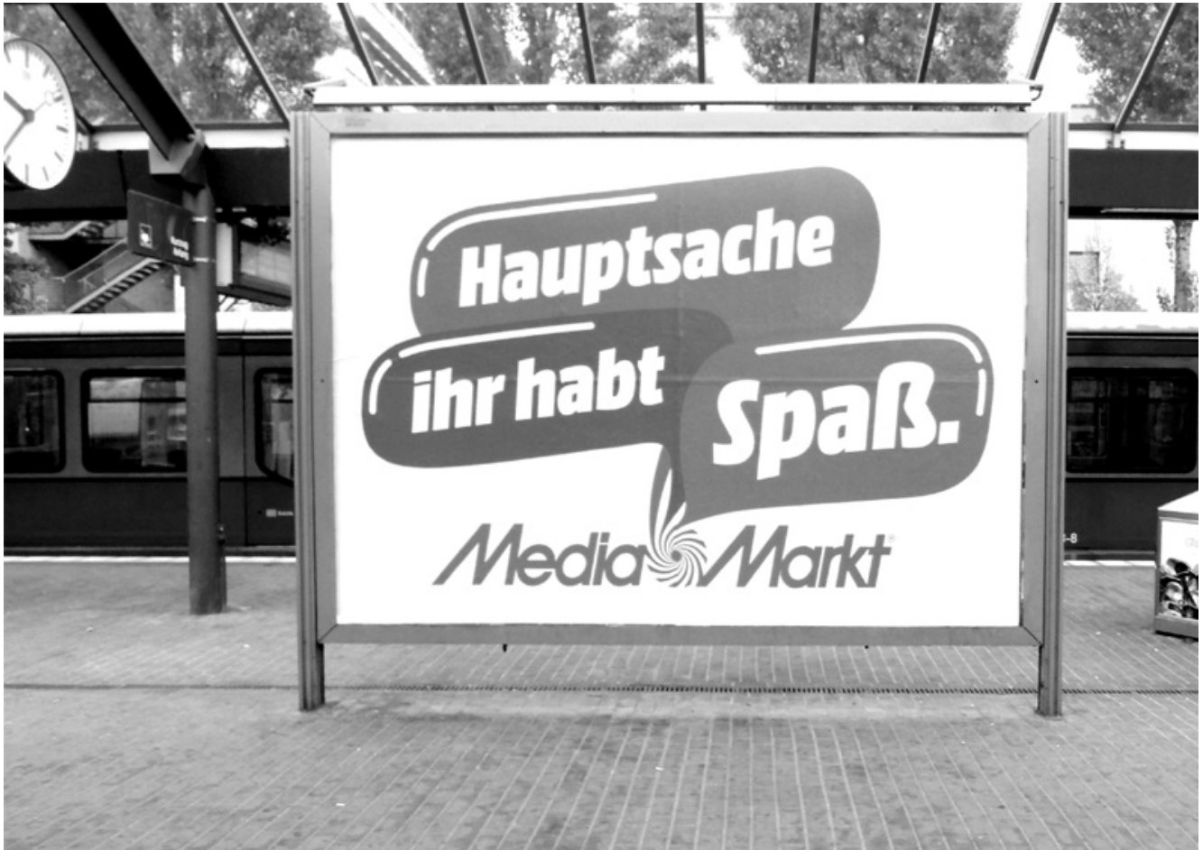
Am 10.10.2015 wurde diese Aufnahme auf dem Hauptbahnhof in Potsdam gemacht. Es war die Fahrt von Potsdam nach Berlin zur Anti-TTIP-Demo. Bei der Demonstration ging es auch um gelebte Demokratie. 250.000 Menschen waren da.